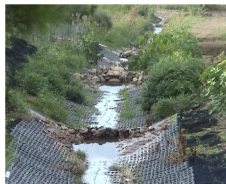
Situazione dopo qualche mese