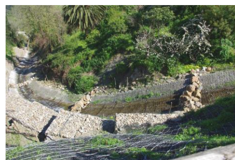
Situazione dopo qualche mese